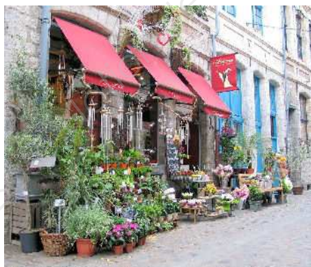
Un fleuriste lillois.

Le nombre de fleuristes est stable depuis 10 ans, même si on en compte 640 de moins. La profession semble moins touchée par la disparition des commerces de proximité. Le nombre de boutiques était de 15.453 en 1996. Il y en a 14.813 aujourd'hui (-4%). Pourtant le nombre de fleuristes avait progressé entre 2002 et 2005, avant de repartir à la baisse en 2006.