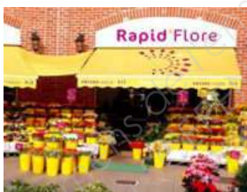
Un fleuriste Rapid Flore.

C'est l'enseigne Monceau Fleurs qui se révèle être la plus rentable des deux. Ses 30 meilleurs franchisés affichent une rentabilité nette de 5,54% en 2010 pour 949 000 euros de chiffre d'affaires. Les boutiques Rapid Flore sont de taille plus modeste. Les meilleures d'entre elles n'affichent que 426 000 euros de chiffre d'affaires et 4,66% de rentabilité.