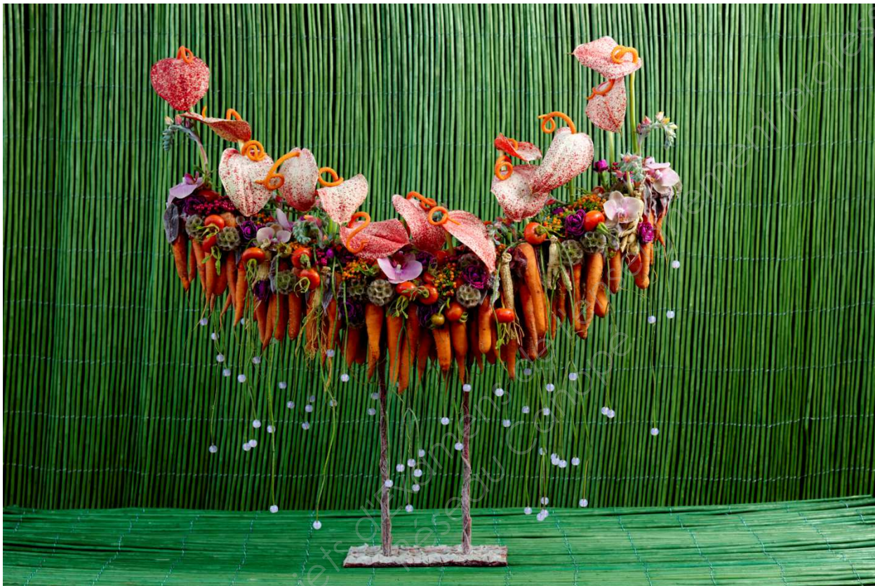
Extrait du cahier de style Interflora 2012