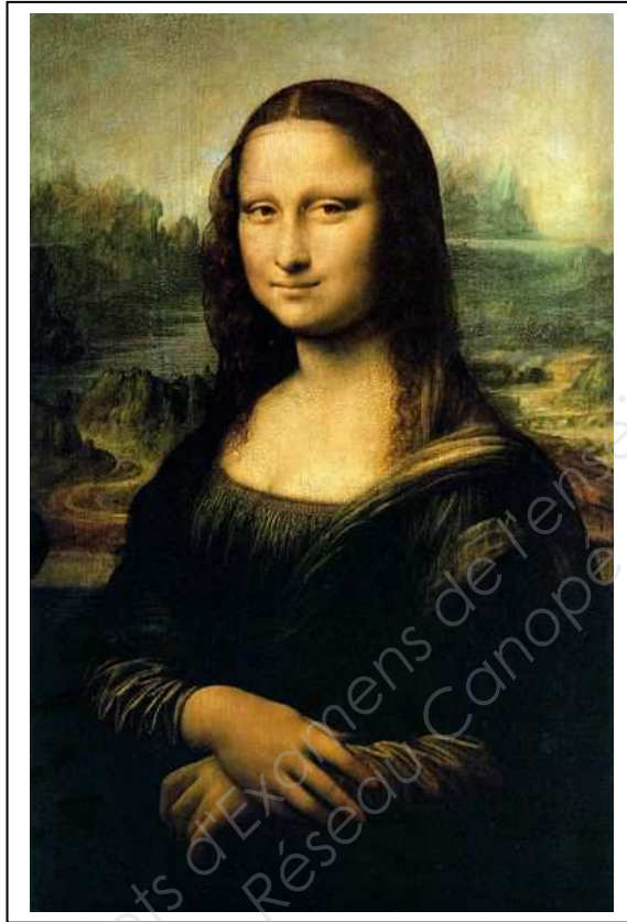
'La Joconde' de Léonard de Vinci