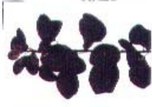
Cotinus cogygria 'Royal Purple'