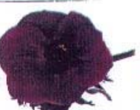
Anemone coronata 'Calli Blauw'