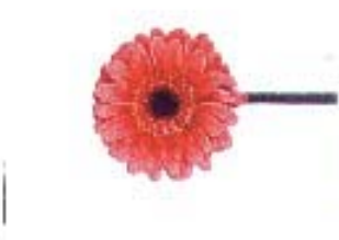
Gerbera (uncolored) 'Brownie'