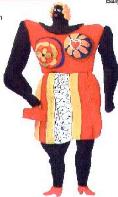
Dolorès circa 1958-1995

Polyester peint et fil de fer 170 x 120 x 50 cm