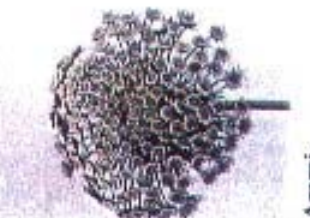
Ammi visnaga 'Green Mist'