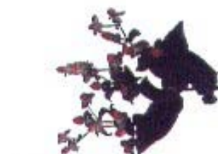
Hypericum 'Pinky Flair'