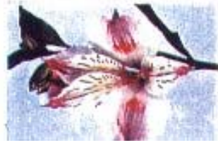
Astroemeria 'Iuk Diamond'