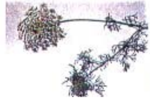
Ammi visnaga 'Green Mist'