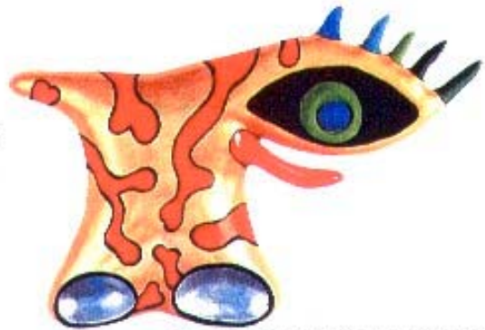
The Magic Eye (Golden and Red) (Remembering), 1997

Bernaltes Polyester 72,3 x 162,5 x 50,8 cm