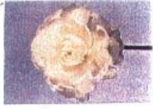
Ranunculus 'Ranuhelle Inra Wit'