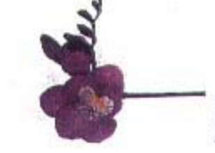
Freesia 'Core d'Azur'