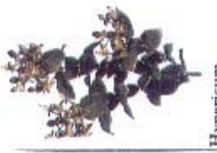
Hypericum 'Autumn Blaze'