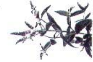
Mentha 'Silver Queen'