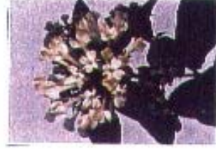
Bouvardia 'Green Spring'