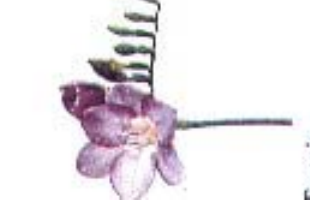
Freesia 'Blue Moon'