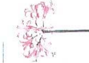
Nerine (Bowdenii Gr.) 'Kas van Roon'