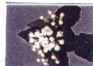
Bouvardia 'Royal Pauline'