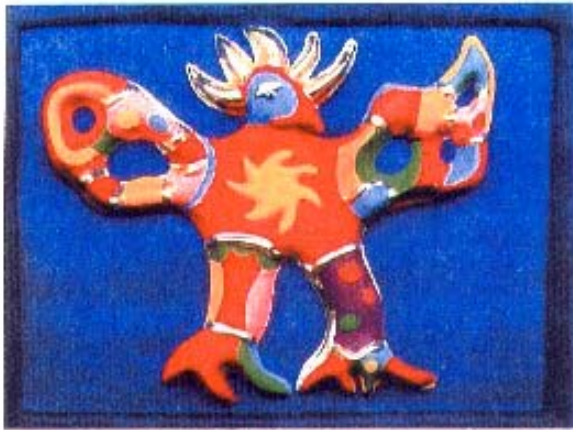
The Sun, 1984