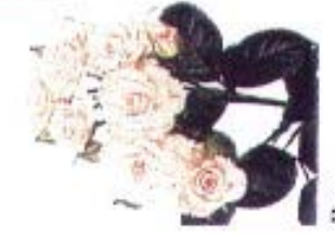
Rosa 'Cream Gracia'