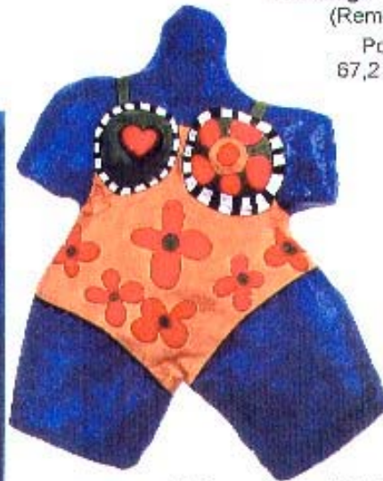
Baigneuse (Last Night I Had a Dream), 1968