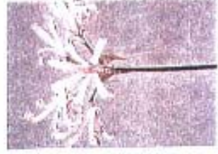
Nerine (Companion Gr.) 'Nikita'