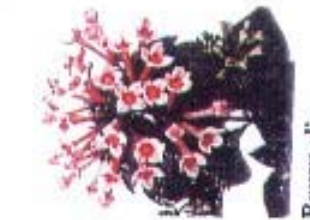
Bouvardia 'Royal Edith'