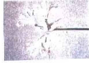
Nerine (Bowdenii Gr.) 'Stefanie'