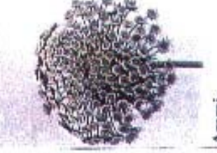
Ammi visnaga 'Green Mist'