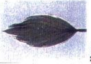
Hosta 'Undulata Albomarginata'