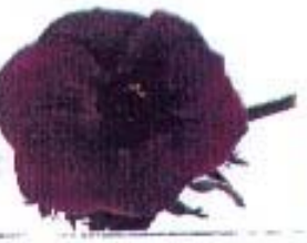
Anemone coronata 'Calli Blauw'