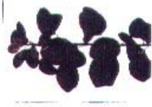
Cotinus cogygria 'Royal Purple'