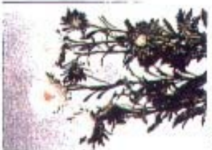
Callistephus chinensis 'Marumoto Wit'