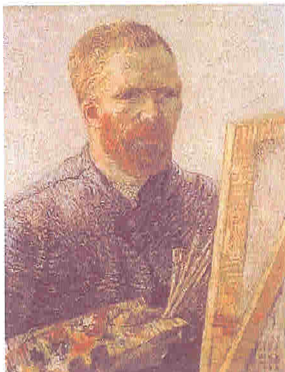
Portrait Vincent van Gogh